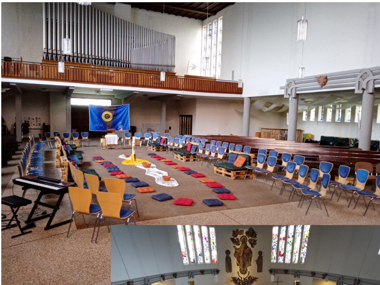
Bilder 1+2: Sitzordnung beim Erprobungsgottesdienst Wort&Wandlung

Beim Erprobungs-Gottesdienst Wort&Wandlung haben wir im Oval gefeiert. Leseult und Altar waren als Tisch des Wortes und Tisch des Mahles als zwei gleichwertigen Brennpunkte einer Ellipse gedacht. Auf Grund der Begrenzung durch die Bänke rechts und links, war die Ellipse aber eher ein Schlauch, was die Sicht erschwerte, weil man so bei der Hinwendung in Richtung Altar oder Leseult direkt in einer Linie hintereinanderstand. Dies könnte durch eine bauchigere Ausformung und eine dritte Stuhlreihe vermieden werden. Wir hatten in diesem Gottesdienst bewusst den Altar im Altarraum genutzt. Zelebrant und Mitfeiernde meldeten zurück, dass dies möglich sei, aber es deutlich stimmiger wäre, wenn der Altar auf gleicher Ebene wäre und der Zelebrant zur Gabenbereitung den „Kreis“ nicht verlassen muss. Deshalb denken wir die normale Sonntagseucharistie in Variante 1+2 auch mit einem mobilen Holzaltar.